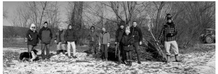
Nabu-Team am 13.02.2021 an der Bruchrainwiese

An zwei Terminen führten wir eine Pflögemaßnahme in der NSG-Kernzone „Bruchrainwiese“ durch. Ziel war wieder der Rückschnitt der Erlen und Weiden, besonders entlang der Gräben und des Laichgewässers. Am 13.02. konnten wir bei kaltem aber herrlichem Winterwetter auch den Traktor einsetzen, um Schnittgut aus der Wiese zu ziehen. Dagegen waren die Temperaturen eine Woche später sehr frühlingshaft. An beiden Terminen konnten sich zahlreiche große und kleine Helfer einbringen. Bei Interesse können Sie sich gerne am Schnittgut bedienen, welches am Wegesrand liegt.