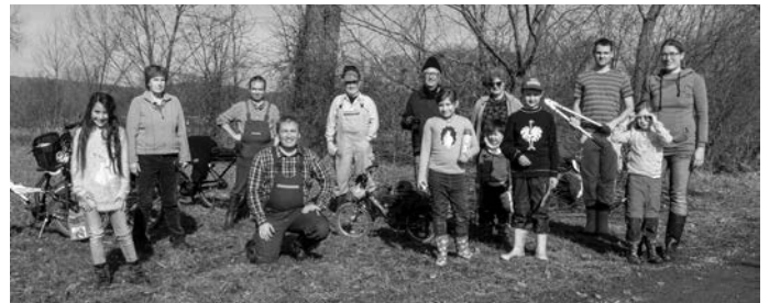
Nabu-Team am 13.02.2021 an der Bruchrainwiese