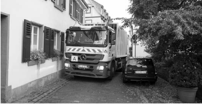
Enge Straßen und vermehrt falsch parkende Autos – während der Corona-Pandemie erschweren zugeparkte Straßen die Arbeit der AVR Kommunal ganz besonders.

Die Abfuhrtermine sind aus dem jeweiligen Abfallkalender zu entnehmen oder online unter avr-kommunal.de . Oder Sie nutzen die automatische Erinnerungsfunktion der kostenfreien AVR Abfall-App: avr-kommunal.de/avr-app .